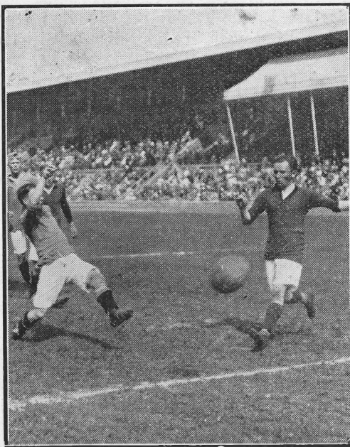
KNATA skjuter Alliansens utjämnande mål.

Ett par bilder från Alliansens bästa match i år.