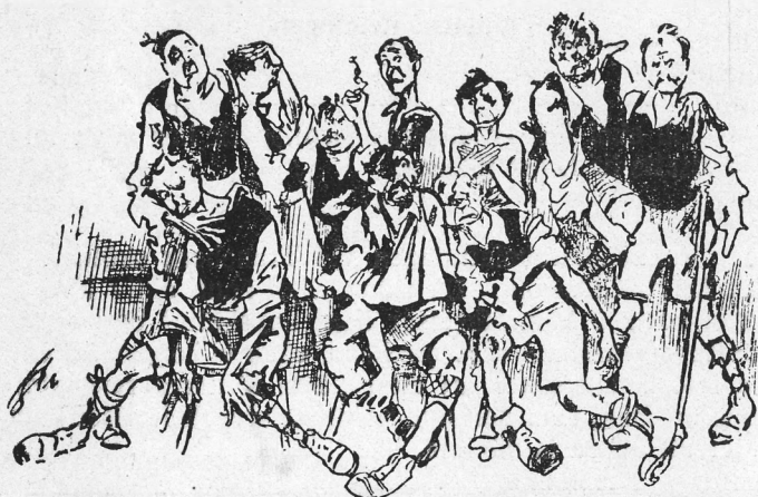
Djurgårdslaget efter matchen mot Göteborgs-Kamraterna den 21 Oktober 1917.

Övre raden fr. v.: Nocke, Fredberg, Knata, Melcher, Lill-Einar, Backis, Köping. Nedre raden: Ekberg, Ragge, Hemming, (Rudén saknas, när han redan hämtats av ambulansen).