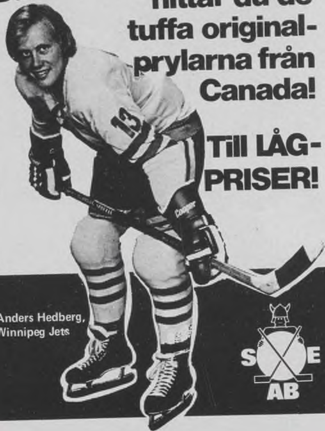
Anders Hedberg, Winnipeg Jets