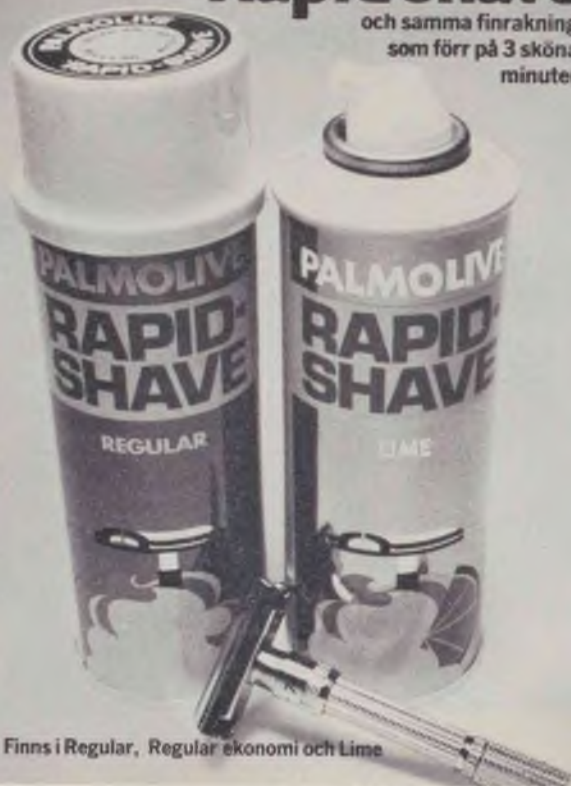
Finns i Regular, Regular ekonomi och Lime

och samma finrakning som förr på 3 sköna minuter