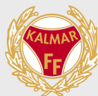
Kalmar FF www.kalmarff.se