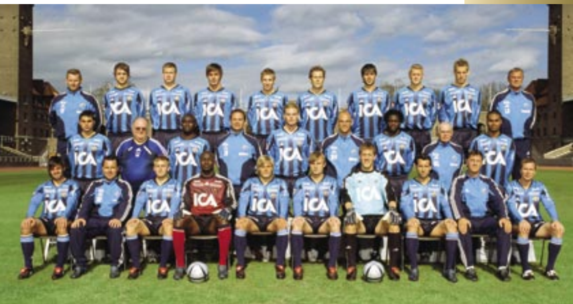
Djurgårdens framgångsrika trupp 2005. Ett år som kröntes med både SM-och cupguld.