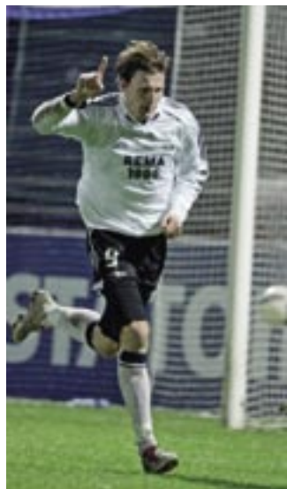
Frode Johnsen, Rosenborg BK.

Rosenborg BK och Vålerenga är de målrrikaste lagen i Royal League med nio mål vardera på fem matcher. Brøndby IF är det lag som har gjort minst mål, fyra stycken. Grupp 2 är den grupp som har gjort minst mål.