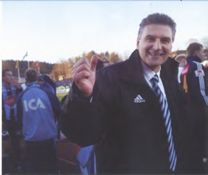
2002 – första SM-guldet sedan 1966.

han hade räknat med den. Han fortsatte att leva utåtriktat och åt middag på sina favoritkrogar. Bland lufsiga allsvenska träningsoveraller blev hans välpressade märkeskostym hans kännetecken under hans intensiva mörka blick.