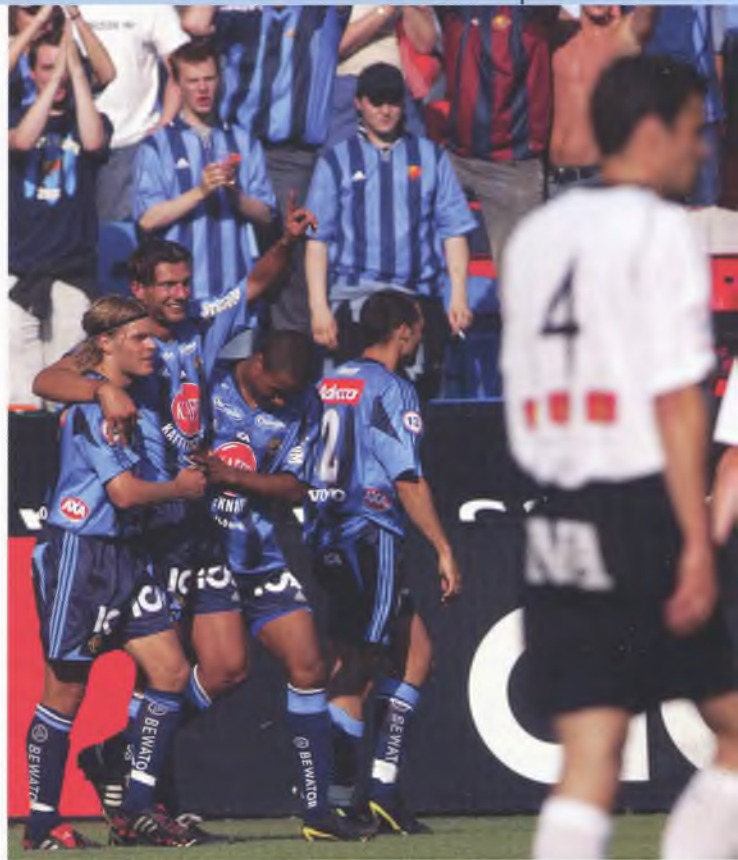
5-1 i lördags mot Örebro gav många positiva intryck.

visst känns det underbart att ha en sådan match med sig in i Allsvenskans andra halva. Det är dock fortfarande stenhårt jobb från alla inblandade som gäller även i fortsättningen. Vi vill ha många fler poäng innan serien är slut.