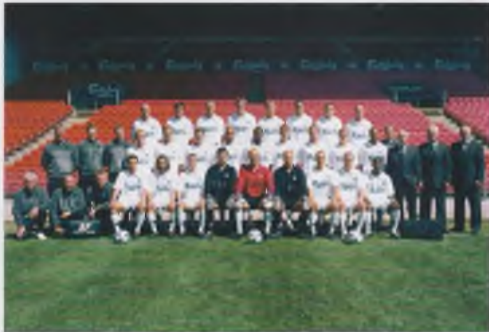
Förra säsongen gick FC Köpenhamn till tredje omgång av UEFA-cupen där de förlorade mot Borussia Dortmund.