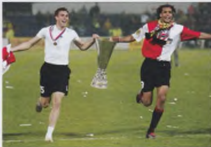
Ovan: Johan Elmander med UEFA-cuppokalen efter finalen mot Borussia Dortmund 2001.