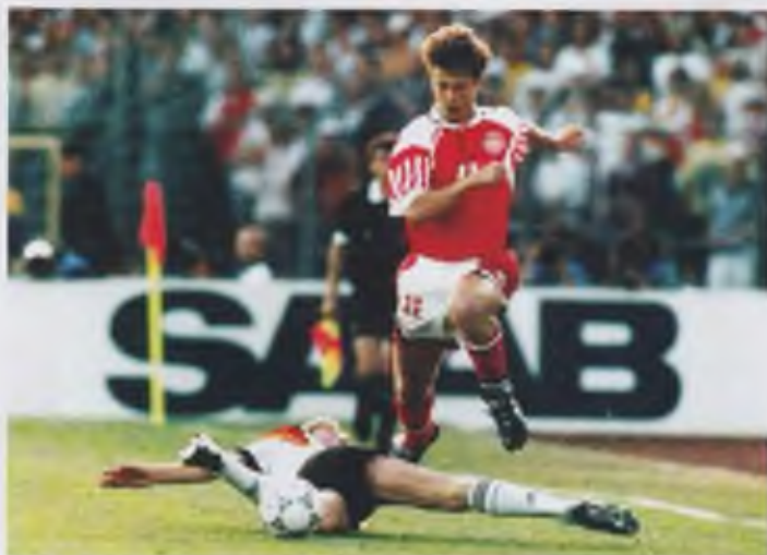
Brian Laudrup i EM-finalen mot Tyskland 1992, som Danmark vann med 2-0.

Brian Laudrup in the 2-0 win over Germany in the final of the European Championships 1992.