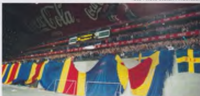
Över fyra tusen djurgårdare var på Parken för två veckor sedan. More than four thousand Djurgården supporters visited Parken.

did qualify to the Cupwinners Cup in 1989. Second and third placed teams goes through to the Uefa Cup the year after, and the same rules applies there. 5th and 6th spot in Allsvenskan played in the Intertotocup the coming year – which really wasn't a cup just a groupstages competition... From 1977 and onwards this "cup" changed it's name to the Tips Cup and it was accordingly there just for the betting companies.