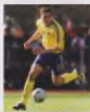
Vänster: Johan Elmander i Sveriges U21-landslag. Left: Johan Elmander in the Swedish youth team.

– There's a big difference in the international game. But I thought we held our ground well against FC Copenhagen in the first match. We were maybe a bit cautious in the beginning but as the match progressed we grew in confidence and had a lot of the play although they owned the ball most of the time towards the end.