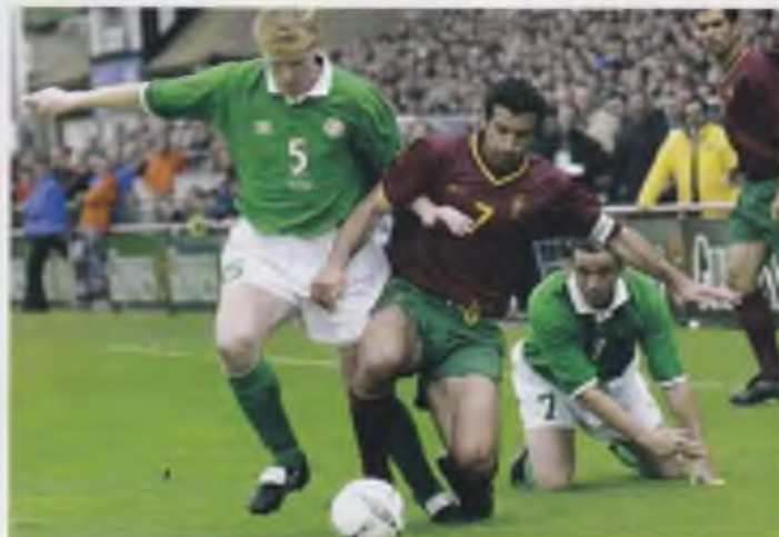
Irland gick, tillsammans med Portugal, vidare från sin VM-kvalgrupp genom att slå ut bland annat Holland. Ireland went, together with Portugal, through to the World Cup, knocking out Holland.

Man diskuterar också intensivt att förbättra anläggningarna, kanske bygga nytt, men har ibland svårt att komma till skott: ett problem som inte minst supportrarna till Shamrock Rovers, Irlands mest framgångsrika klubb genom tiderna, känner till. Och Djurgårdens supportrar också, för den delen.