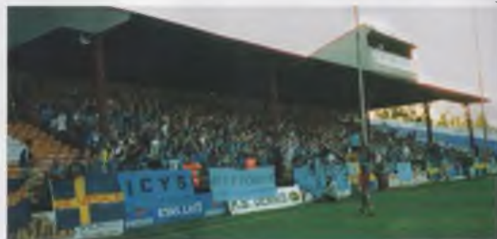
Huvudläktaren på Tolka Park i Dublin för två veckor sedan. The main stand at Tolka Park in Dublin two weeks ago.

Allsvenska and also the Swedish Cup which meant that Djurgården was defeated in the Cup final by Malmö and did qualify to the Cupwinners Cup in 1989.