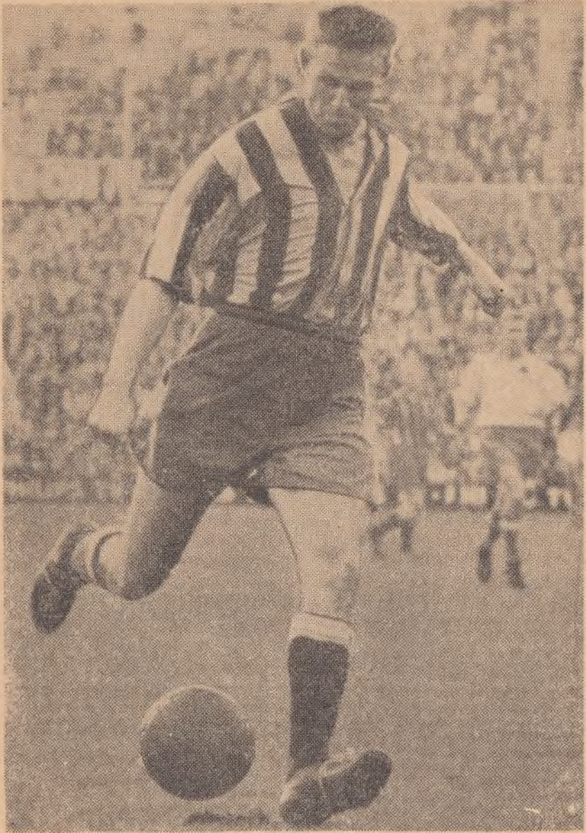
Tumba leder Djurgårdens skytteliga hittills.