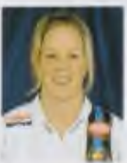
Malin Nykvist Born: 19 May 1979 Country: Sweden