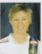
Anna Hall Born: 21 April 1979 Country: Sweden