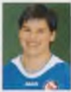
Ariane Hingst Born: 25 July 1979 Country: Germany