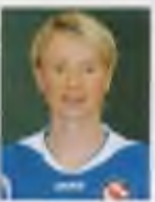
Conny Pohlers Born: 16 November 1978 Country: Germany