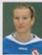
Anja Mittag Born: 16 May 1985 Country: Germany