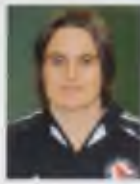
Nadine Angerer Born: 10 November 1978 Country: Germany