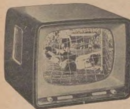
Typ 405. 17" Riktpris 1.295: -

en västtysk apparat av högsta kvalitet. Finns i 17" och 21" bordsmodeller samt 21" golvmödel. Stilen exteriör med hoggglanspolarat ädelträ. Dubbla högtalare samt gråglas, vilket spar ögonen. 90° vidvinkelbildrör, enastående bildskärpa genom Körting BQV-bandfilter. Kontrastregister som möjliggör en förenklad kontrastinställning i sex steg medelst tryckknappar och ljudregister som möjliggör en anpassning efter sändningens art.