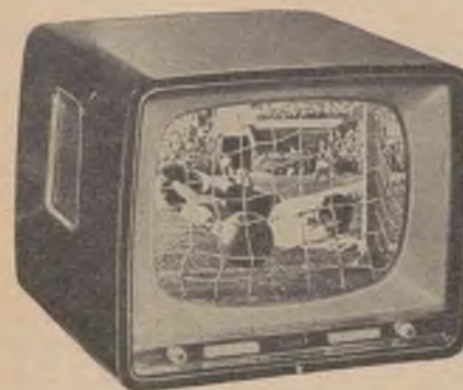
Typ 405. 17" Riktpris 1.425:—

en västtysk apparat av högsta kvalité. Finns i 17" och 21" bordsmodeller samt 21" golvmödel. Stilren exteriör med högglanspolarat ädelträ. Dubbla högtalare samt gråglas, vilket spar ögonen. 90° vidvinkelbildrör, enastående bildskärpa genom Körting BQV-bandfilter. Kontrastregister som möjliggör en förenklad kontrastinställning i sex steg medelst tryckknappar och ljudregister som möjliggör en anpassning efter sändningens art.