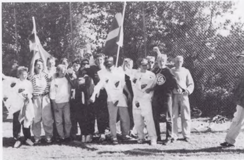
75:orna inför 77:ornas semifinal