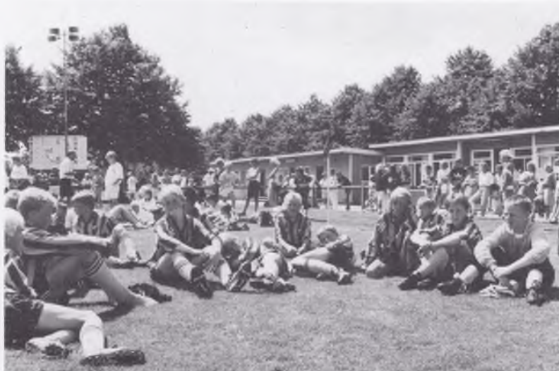
I väntan på prisutdelningen.