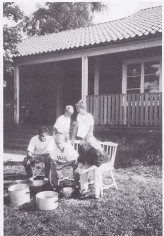
Potatisskalning är ett mycket populärt inslag, speciellt hos alla morsor.

NY TELEFONTID DJURGÅRDENS UNGDOMSFOTBOLL 08.30 - 11.30