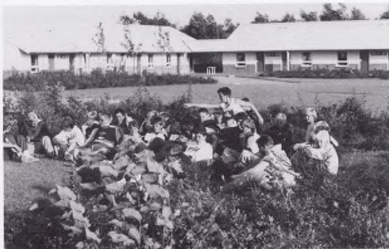
75:or och 77:or utanför hotellet.