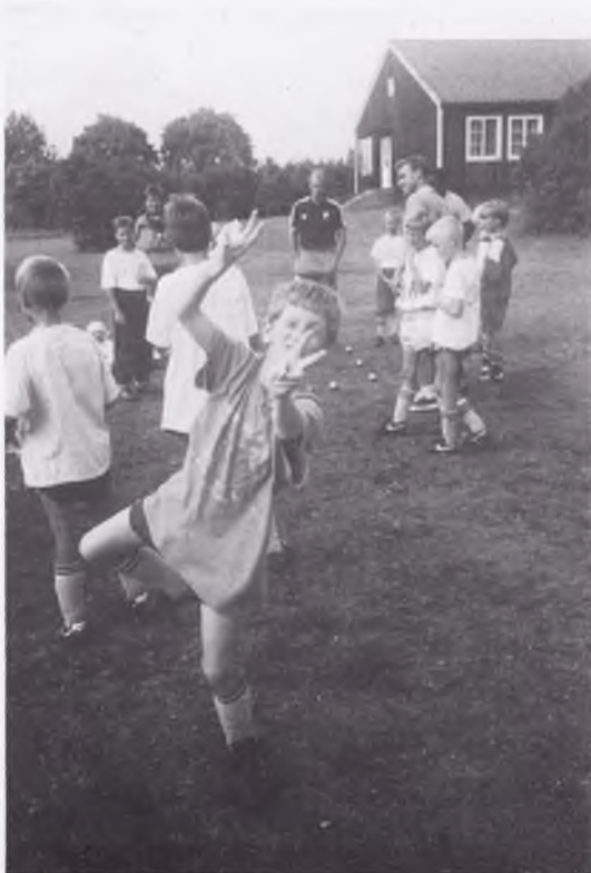
5-kamp på gång och V-tecknet är givet.

NY TELEFONTID DJURGÅRDENS UNGDOMSFOTBOLL 08.30 - 11.30