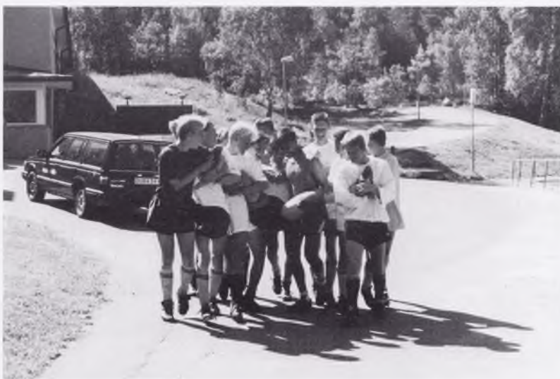
Sista dan och hög tid för hämnd