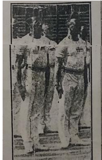
Olympiskt medaljör-par i gymnastik 1912: Calle Silverstrand (Norges idrottsmanare) och Norling.