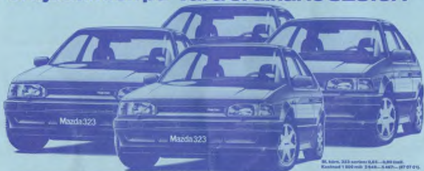
323, 323i, 323i kombi 1.6i, 1.8i och 2.0i. Kostnad 1 800 mil/ 2 640... 5 467... (87 07 01)

Vi tömmer våra lager för att få plats med nya Mazda Kansei – det betyder specialerbjudanden på våra ordinarie 323:or!